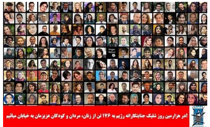
۱۱ مهر ۱۴۰۱ / ۳ اکتبر ۲۰۲۲

جمهوری اسلامی حکومتی ضد زن، ضد زندگی و ضد آزادی است و باید برود. ما از همه نهادهای بین‌المللی و دولتها میخواهیم جمهوری اسلامی را بایکوت کنند؛ روابط دیپلماتیک خود را با این حکومت فساد و جنایت و ترور قطع کنند، سفارتخانه‌هایش را ببندند و نمایندگان آنرا از همه نهادهای بین‌المللی مثل سازمان ملل و سازمان جهانی کار اخراج کنند. جمهوری اسلامی نماینده مردم ایران نیست، قاتل آنهاست! کمیته مبارزه برای آزادی زندانیان سیاسی