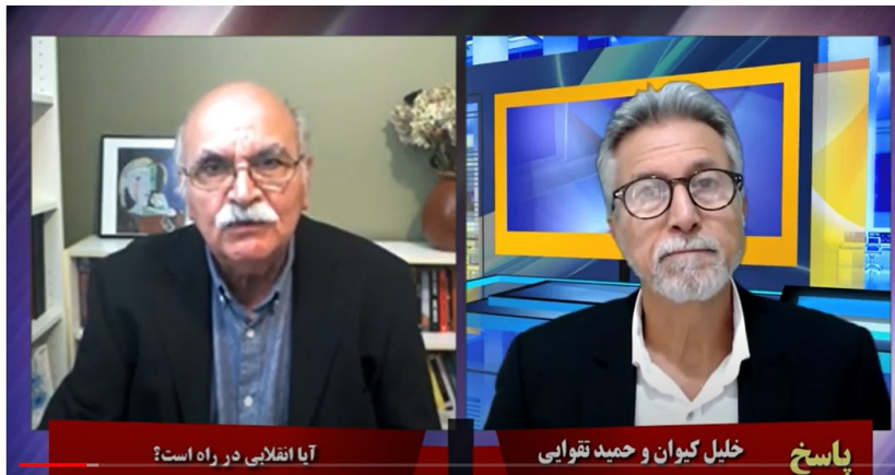
آیا انقلابی در راه است؟