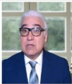
جنجال بر سر هیچ حسن صالحی

بر شرایط کوبند اما موفق نشده اند و جامعه آنها را پس زده است.