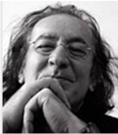
جریانات راست و رویای گذشته سیاوش مدرسی

تلاش میکند چهره مفلوک خمینی را باز آفرینی کند. شاید بتواند این بار به ضرب جنگ با اسرائیل و امریکا، غنی سازی و سازمان دادن مزدورانش در منطقه خودش را بزک کند و ناامیدانه در شکافهای توازن جنگ اکرائین به حمایت پوتین درهم شکسته آویزان شود، نظام الهی سرمایه دستگیر میکند! و همزمان صدای مرگ بر خانه‌های را از زندان گرفته تا کوچه و باور ندارند که امروز جامعه بعد از تجربه ۴۳ سال علیه همین راهکارها به میدان آمده است! کشاکش گانگسترها و مافیاهای حاکم با اعماق جامعه با کارگران، معلمین، زنان و جوانان، بازنشستگان و خانوارهای دادخواه از دهه ۱۳۶۰ تا همین امروز، وارد مرحله سرنوشت سازی میشود. این دیگر نه صدای پای انقلاب که غرش طوفان انقلاب است که بگوش میرسد. انقلابی که در اعماق جامعه سازمان یافته است که صدها رهبر رادیکال دارد که رهبرانش ارتباط وسیع اجتماعی با داخل و خارج دارند. این سیلاب را نمیتوان در دلانهای اختلافات درون و برون خانوادگی سرمایه‌داری کانالیزه کرد، این انقلاب خود سخنگو، رهبران و سازمانهای خودش را دارد و ادامه صفحه ۱۰