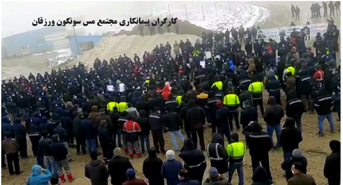
کارگران پیمانکاری مجتمع مس سونگون ورزقان