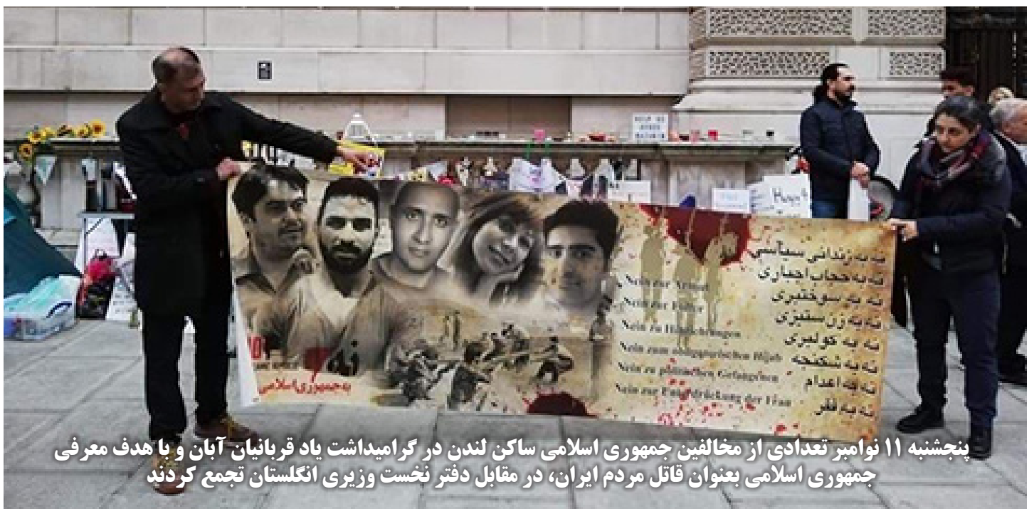
پنجشنبه ۱۱ نوامبر تعدادی از مخالفین جمهوری اسلامی ساکن لندن در گرامیداشت یاد قربانیان آبان و با هدف معرفی جمهوری اسلامی بعنوان قاتل مردم ایران، در مقابل دفتر نخست وزیر انگلستان تجمع کردند

خیزش آبان که در متن اعتراضات کارگری وسیع از جمله اعتصابات و اعتراضات متعدد و ادامه دار کارگران هفته تپه شکل گرفته بود، خود زمینه گسترش هر چه بیشتر اعتصابات و اعتراضات کارگری شد.