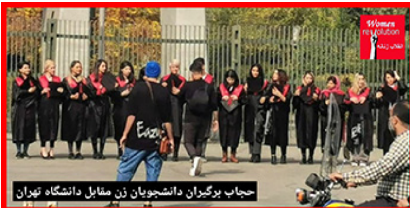
حجاب برگیران دانشجویان زن مقابل دانشگاه تهران