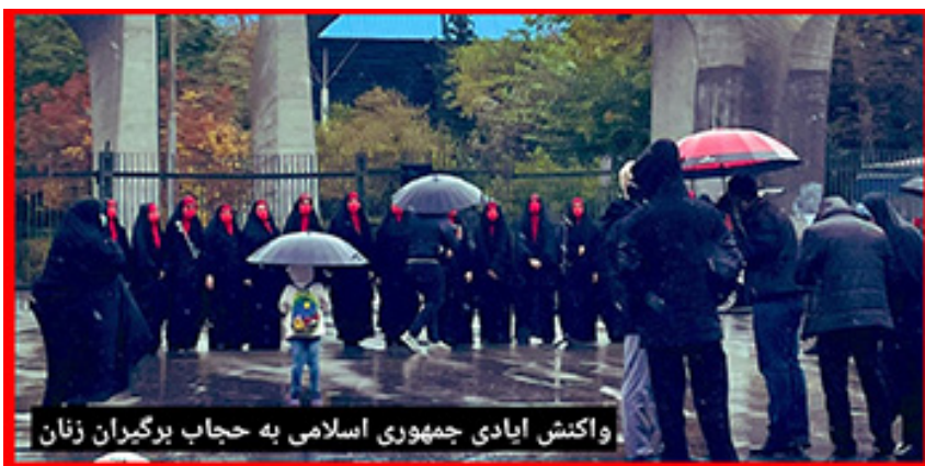
واکنش ایادی جمهوری اسلامی به حجاب برگیران زنان

اخیرا ایادی جمهوری اسلامی در یک حرکت سازماندهی شده در واکنش به حجاب برگیران دانشجویان زن مقابل دانشگاه تهران، با حجاب کامل اسلامی در همان مکان به صف شدند تا از حجاب و ارزشهای جمهوری اسلامی دفاع کنند.