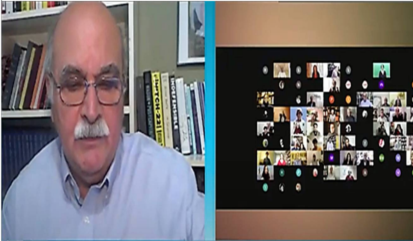
پلنوم ۵۲ حزب کمونیست کارگری ایران