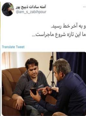
05:47 · 12/12/2020 · Twitter for Android

شده. "انسان" وقتی به مقام اشرف مخلوقات نایل میشود که در مقام یک بنده، خود را تا حد یک موجود درنده در عین حال به شدت ترسو فرو کاسته باشد. شجاعت ایشان تا وقتی برجاست که طناب دار پا برجاست.