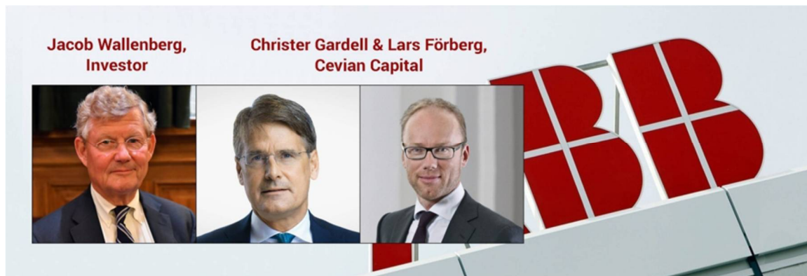
Jacob Wallenberg, Investor

همزمان همین آقا و خانواده اش که از سهامداران بزرگ شرکت دیگری بنام SKF که خود از شرکتهای بسیار بزرگ در سوئد است، بدلیل وضعیت دوران کرونا علاوه بر اخراج و کم کردن کارخشی بزرگی از کارکنان