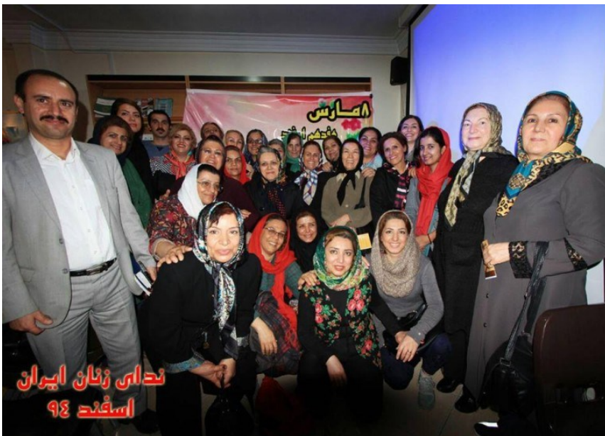
ندای زنان ایران اسفند ۹۴