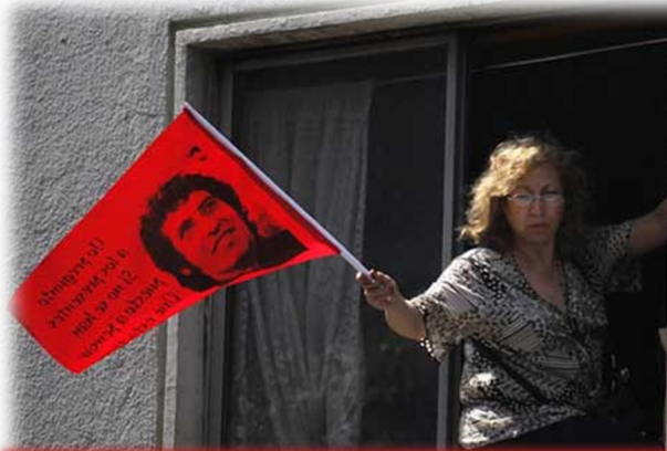
برای شنیدن ترانه مانیفست ویکتور خارا بر روی تصویر کلیک کنید

و کیف‌خواست علیه سرانش صادر شده است. به یاد داشته باشیم که با سرنگونی جمهوری اسلامی در دادگاه‌های مردمی سرود آزادی خواهی ویکتور خارا را پخش کنیم.*