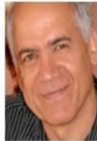
اصغر کریمی رئیس هیئت اجرایی