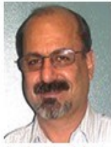
محسن ابراهیمی رئیس دفتر سیاسی