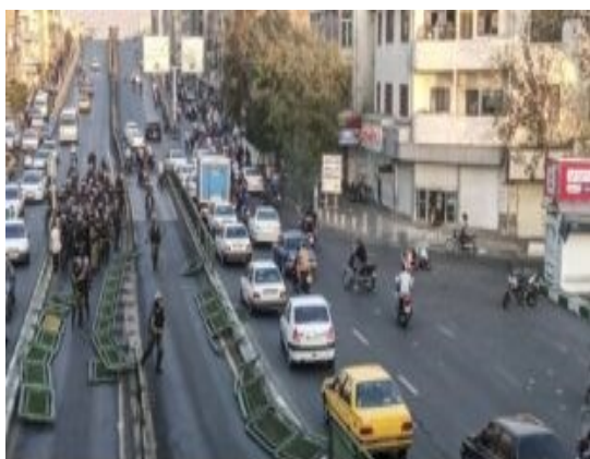
آزادگی برپا می آید از خیابانهای تهران در شبانه چهارم مهرماه

خیزش های مردمی: شماره ۷۹ ۲ آبان: دو روز اعتصاب و تحصن سراسری معلمان در ۳۰ شهر اعتراضات گسترده در دانشگاهها و اعتراضات شبانه طی دو روز گذشته معلمان در ۳۰ شهر دست به اعتصاب و تحصن زدند. این اعتصاب و تحصن بنا به فراخوان شورای هماهنگی تشکلهای صنفی فرهنگیان انجام شد که به سرکوب سیستماتیک معلمان، دانش آموزان و مردم، اعتراض کرده اند. گزارشات تاکنونی از این شهرها خبر میدهند: سنندج، شیراز، سقز، کامیاران، مریوان، بوکان، لاهیجان، جوانرود، بانه، نیشابور، همدان، کرمانشاه، مهاباد، بندرانزلی، سروآباد، میاندوورد، روستای آبی سقز، نورآباد ممسنی، دلفان لرستان، بجنورد، کرج، باغملک خوزستان، زیویه، اراک، خرم آباد، کاشان، شهریار، بجنورد، ایلام و ساوجبلاغ. امروز همچنین پزشکان در شیراز با شعار "مرگ بر