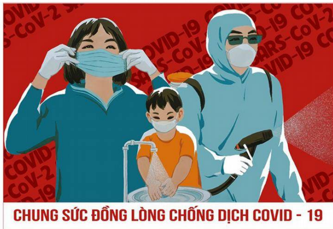
CHUNG SỨC ĐỒNG LÒNG CHỐNG DỊCH COVID - 19