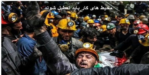
محیط های کار باید تعطیل شوند

نه تنها وزیر بهداشت بلکه مرکز پژوهش های مجلس اسلامی هم پیامد ویروس کرونا را ناامنی! اجتماعی پیش بینی کرده است. روشن است که ناامنی اجتماعی در فرهنگ واژگانی رژیم کرونایی