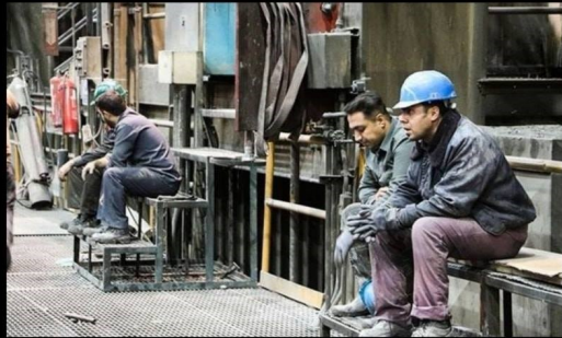
بیمه بیکاری برای همه کارگران بیکار و کارگران فصلی

و در این شرایط سخت نباید هیچکس نگرانی تامین معیشت و مسکن را داشته باشد. دولت موظف است از ثروتهای اجتماعی و با اقدامات اضطراری زندگی تک تک مردم بویژه بخشهای آسیب پذیر و محروم جامعه را تامین کند.