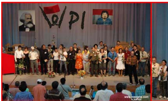
رفقای که در تدارک و سازماندهی کنگره فعال بودند از طرف کنگره گل دریافت میکنند

یا سوسیالیسم یا بربریت زنده باد جمهوری سوسیالیستی