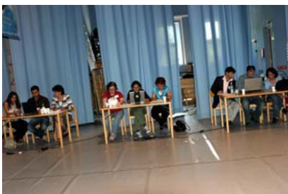
هنگام شمارش آرا برای انتخاب کمیته مرکزی