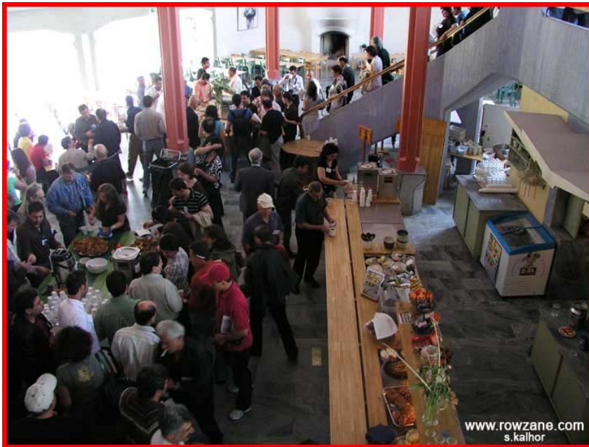
شرکت کنندگان در کنگره هنگام استراحت و نهار

TD Canada Trust A. Mikanik transit#1672 Institution#504 Acc#6235975