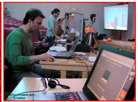
در حال آماده کردن سیستم پخش کنگره از طریق اینترنت