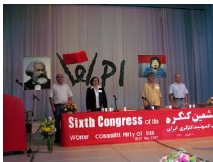
هیئت رئیسه هنگام خواندن سرود انترناسیونال