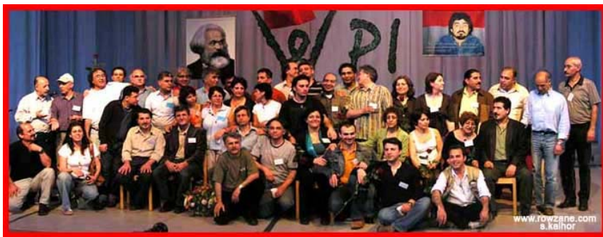
عکسی از کمیته مرکزی منتخب کنگره ۶

در ابتدای کنگره رفیق عصام شکر دیبر کمیته مرکزی حزب کمونیست کارگری چپ عراق، به زبان انگلیسی و عربی به کنگره پیام داد. در روز دوم کنگره در مبحث مالی ۴۶ نفر از نمایندگان و شرکت کنندگان در کنگره متعهد شدند که برای کمک به تلویزیون حزب که بزودی از هات برد برنامه های ۲۴ ساعته خود را آغاز خواهد کرد، ماهانه مبلغ معینی به حزب کمک مالی کنند. مجموع این کمکها بالغ بر ماهی ۸۰۰۰ دلار است. لیست این کمکهای مالی جداگانه منتشر خواهد شد.