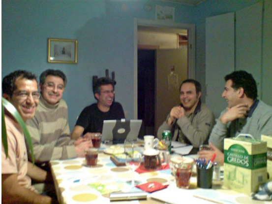
جلسه کمیته تدارک کنگره ۶