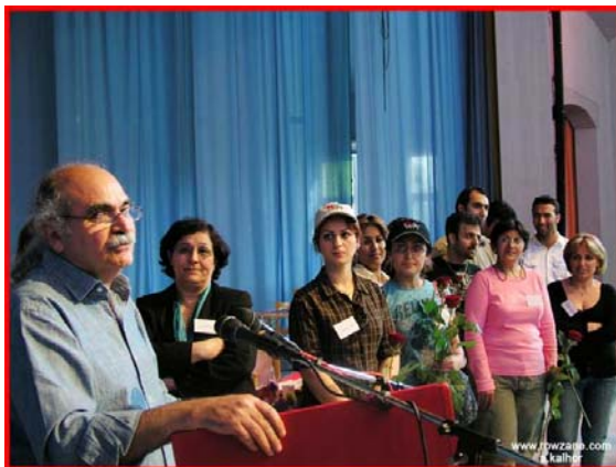
تعدادی از شرکت کنندگان که در کنگره ۶ به حزب کمونیست کارگری پیوستند