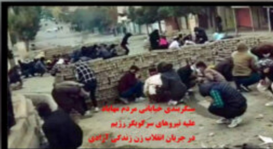
سرکوبی خیابانی مردم میانه قلبه نیروهای سرنگونی رژیم در جریان انقلاب زن زندگی آزادی