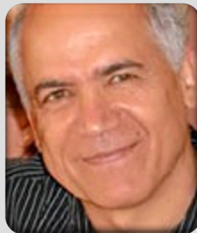
اصغر کریمی رئیس هیئت اجرایی