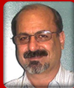
محسن ابراهیمی رئیس دفتر سیاسی